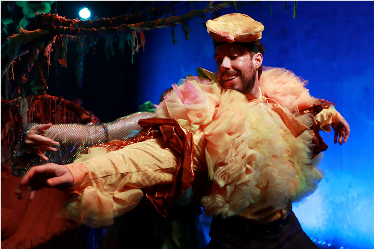
Personerna dansar till musiken. Om jag vill får jag också dansa tillsammans med dem.