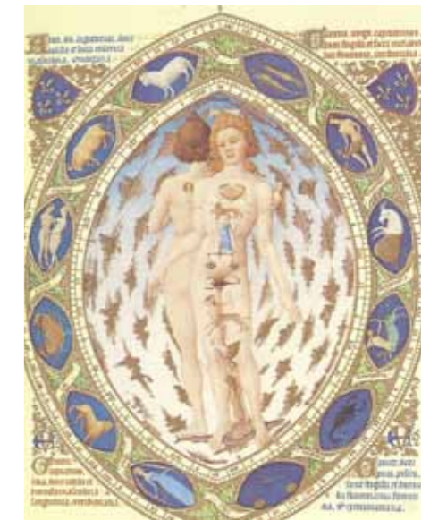
Foto: Mikrokosmos inramad av Zodiaken ur Les très riches heures du duc de berry.