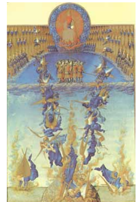
Foto: Lucifers fall från himlen ur Les très riches heures du duc de berry.

Efter Viktor Rydbergs "Medeltidens Magi" (redigerad essä)