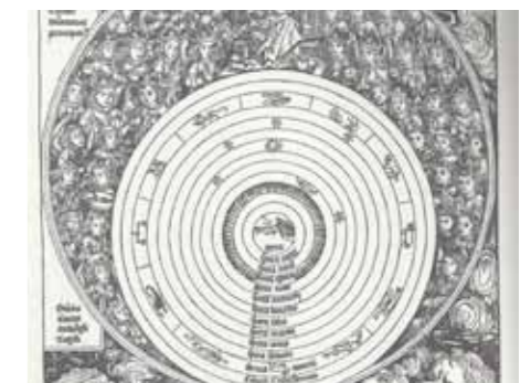
Foto: Medeltidens bild av universum ur Schedels Weltchronik